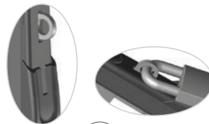
Вариант с замком