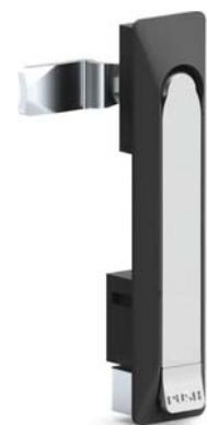
Без цилиндра '00'